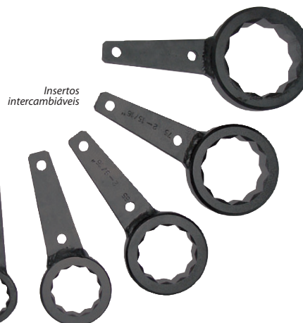
TABELA DE SELEÇÃO DOS INSERTOS INTERCAMBIÁVEIS