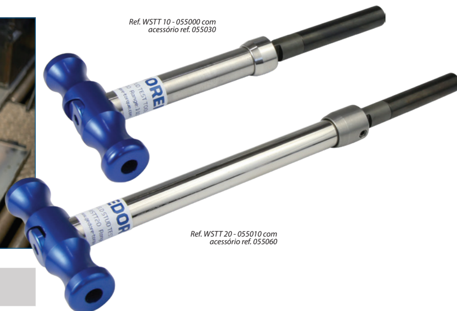
Ref. WSTT 10 - 055000 com acessório ref. 055030