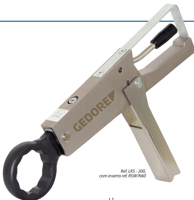
Ref. LKS - 200, com inserto ref. RSW/N60